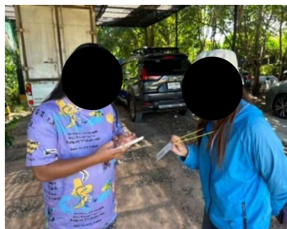
ภาพที่ 2-6 การแจกแผ่นพับการประชาสัมพันธ์โครงการ