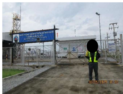
โครงการท่อส่งก๊าซธรรมชาติไปยังโรงไฟฟ้าหนองระเวียง 2