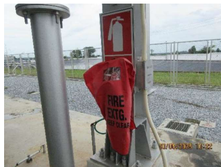
ภาพที่ 2-2 ถังดับเพลิงแบบเคมีผงที่สถานีควบคุมความดันและวัดปริมาณก๊าซธรรมชาติ (MRS)