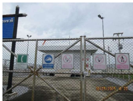
โครงการท่อส่งก๊าซธรรมชาติไปยังโรงไฟฟ้าหนองระเวียง 2