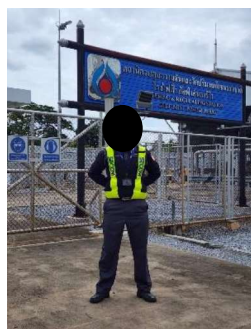
โครงการท่อส่งก๊าซธรรมชาติไปยังโรงไฟฟ้าหนองระเวียง 1