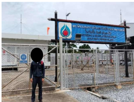
โครงการท่อส่งก๊าซธรรมชาติไปยังโรงไฟฟ้าหนองระเวียง 1