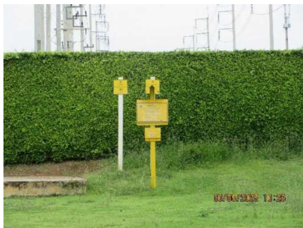
โครงการท่อส่งก๊าซธรรมชาติไปยังโรงไฟฟ้าหนองระเวียง 1