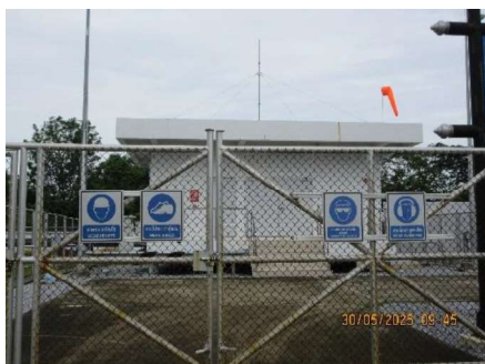
โครงการท่อส่งก๊าซธรรมชาติไปยังโรงไฟฟ้าหนองระเวียง 1