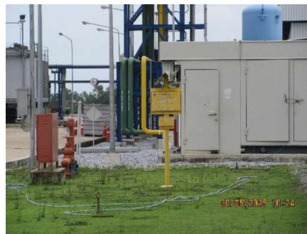
โครงการท่อส่งก๊าซธรรมชาติไปยังโรงไฟฟ้าหนองระเวียง 2