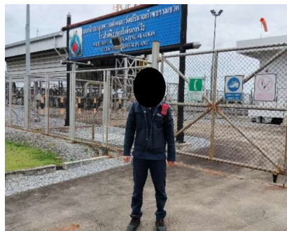
โครงการท่อส่งก๊าซธรรมชาติไปยังโรงไฟฟ้าหนองระเวียง 2